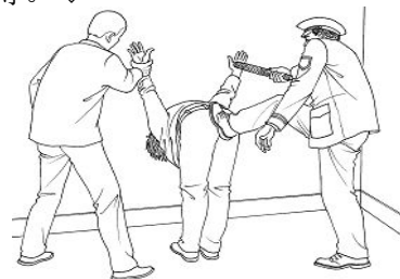
中共酷刑示意图：“飞”