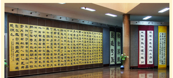
2007 年 11 月 3 日至 8 日刘锡铜先生在青岛市出版艺术馆举办的书法艺术展上的部份作品。