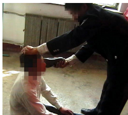
中共酷刑示意图：鞋底抽打