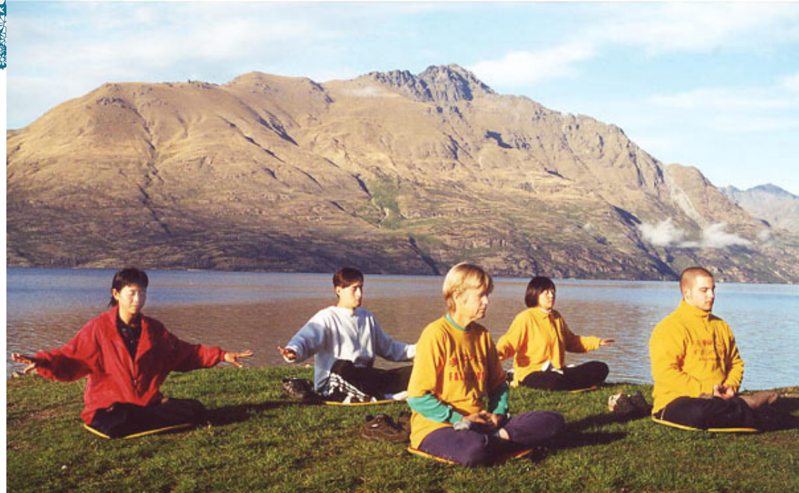
▲ 2001 年 5 月 16 日新西兰法轮功学员在炼功

修炼法轮功的妈妈希望富玲一起来炼功，也许身体会有改善，富玲姑且一试，但并没重视。不久，她到商场买遮瑕膏，在几个专柜咨询辗转间，无意间听到一位护肤小姐与人窃窃私语说：“那个小姐的皮肤真的很差。”青春少女，正是爱美的年龄，如何不介意