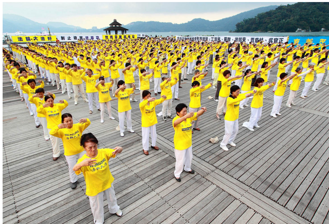
▲ 2010年7月18日，部分台湾法轮功学员集体炼功

“我很想再次回到中国，越快越好，我想见中国的法轮功学员们，而不是去坐牢。我想念那次新年晚会，我想他们。我知道他们很多人都因为受中共残酷迫害而不在世了，那些活着的法轮功学员，如果能和他们再见面，那该多好啊！我期待着这一天……”