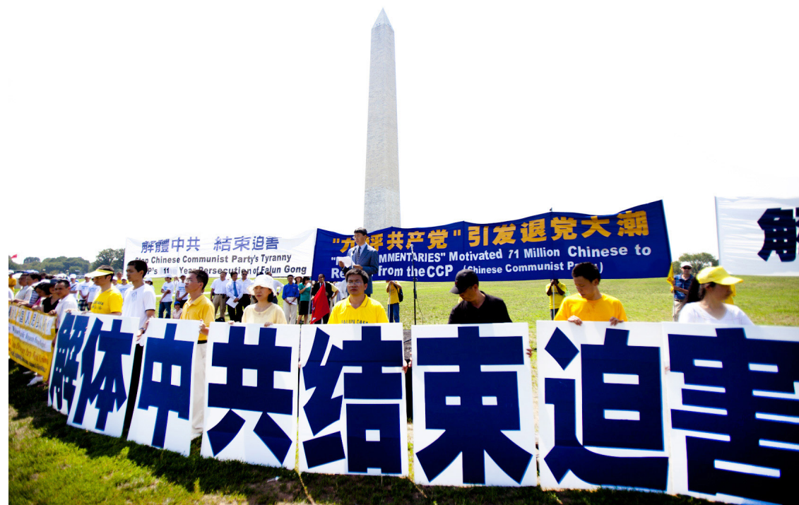
▲ 2010年7月23日美国华盛顿法轮功学员声援反迫害

2012年9月联合国人权理事会第21次会议上，中共活摘法轮功学员器官的罪行成为焦点。随后，美国国会、加拿大国会、欧洲议会都进行了相关内容的听证会。2014年美国众议院发起281号决议案，要求中共立即停止针对法轮功学员和其他良心犯的活摘器官行为。至今中共仍拒绝第三方的独立调查，也无法说明大量可疑移植器官的来源。