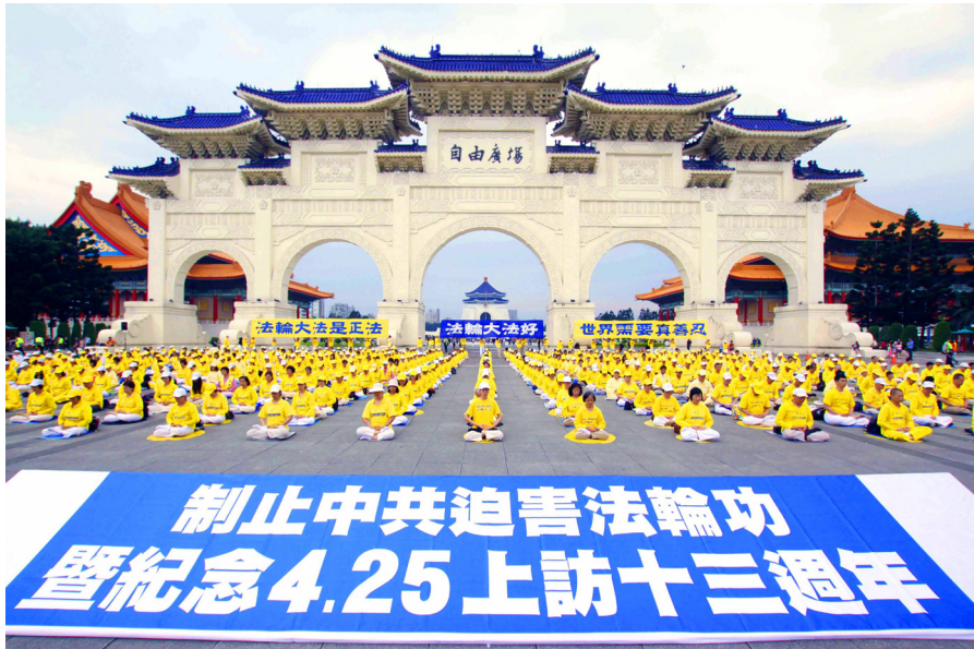
▲台湾法轮功学员纪念4·25上访十三周年

法轮功学员所表现出的和平理性和对正信与公义的坚守，得到了国际社会的高度评价，“4·25”上访被称作“中国上访史上规模最大、最理性平和、最圆满的上访”。