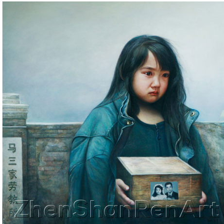
油画《孤儿泪》，41 x 41 英寸，2006 年，作者：董锡强。

安徽合肥市法轮功学员吴伟明被关押多年，2006 年出狱时，面临的是：父亲已故，丈夫离婚，母亲病