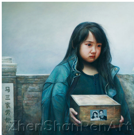
油画《孤儿泪》，41 x 41 英寸，2006 年，作者：董锡强。

安徽合肥市法轮功学员吴伟明被关押多年，2006 年出狱时，面临的是：父亲已故，丈夫离婚，母亲病