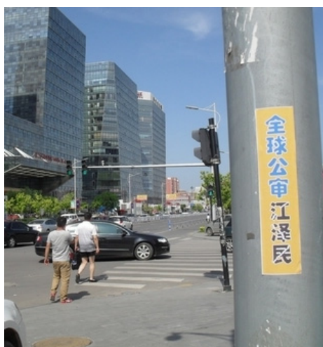
大陆某市街头巷尾可见“全球公审江泽民”标语

江泽民一意孤行，造成了对大陆法轮功学员持续至今的长达 16 年的残酷迫害。为了制止迫害、惩恶扬善、让更多的民众知道法轮大法好的真相，今年 5 月以来，大陆各地法轮功