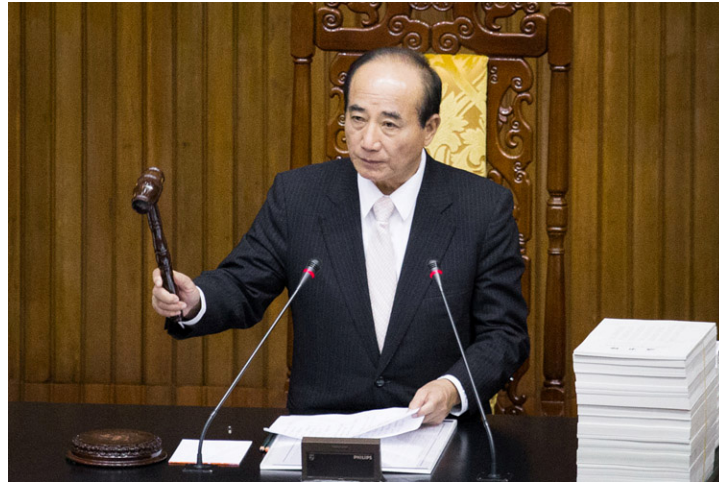
台湾立法院院长王金平

这个正式的立法出台，表面上是禁止台湾民众涉嫌买卖非法人体器官，成为帮凶，而实际也间接地、有针对性地佐证了，在中国大陆存在大规模活摘人体器官现象，因为在世界上，除