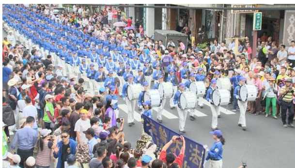
图：近两百人的天国乐团进入鹿港庆端阳踩街活动现场,壮观气势,吸引所有人的目光。

【明慧网】2015年6月20日,适逢一年一度的端午节。名列台湾交通部观光局“全国十二大节庆活动”之一的“鹿港庆端阳系列活动”,在20日下午举办了热闹的踩