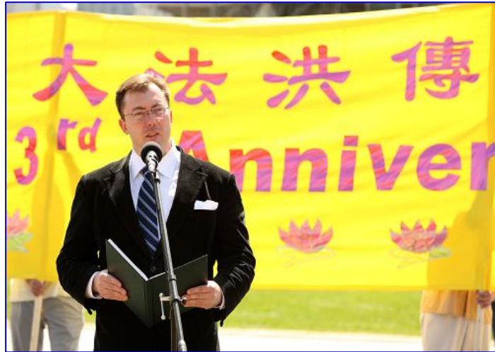
图: 加拿大国会议员罗伯·安德斯(Rob Anders)

此表示,对周永康的审判只触及了腐败问题,他认为,要象剥洋葱那样挖出迫害法轮功的黑幕的核心。他说:“要象剥洋葱一样一层层地剥开,就会挖出黑幕的核心——人权践踏、谋杀、酷刑和一切