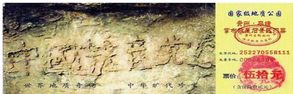
图：2002 年 6 月在贵州发现的“藏字石”断面上显现“中國共產黨亡”六个大字，昭示着“天灭中共”的天意。

《九评共产党》一书真实深刻地揭露了中共的邪恶本质，截至 2015 年 6 月 23 日，已有超过 2.07 亿中国民众在海外大纪元网站声明退出中共的党、团、队组织。天灭中共，退党、团、队（三退）保命。