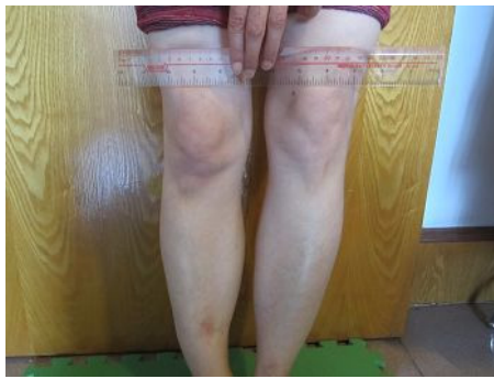
右小腿比左小腿短三厘米左右

了, 使得通过修炼法轮功逐渐恢复的腿伤开始严重恶化, 骨头肌肉及整个身体右侧肌肉萎缩, 右侧整个骨骼塌陷, 比较正常的左侧, 外观上都能看出来(造成现在我骨折的右小腿比正常的左腿短三厘米左右, 而且两腿并拢时可以看到受伤的右小腿比正常的左小腿弯曲有一点五厘米以上)。