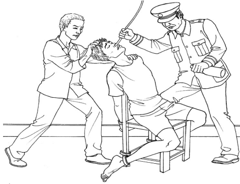
中共酷刑示意图:灌食、灌水

一九九九年七月二十日去省城武汉上访,被非法关押在咸宁温泉岔路口派出所的铁笼子里,晚上蚊子咬得无法闭眼。第二天被送往双鹤看守所关押十五天,被勒索伙食费300元。