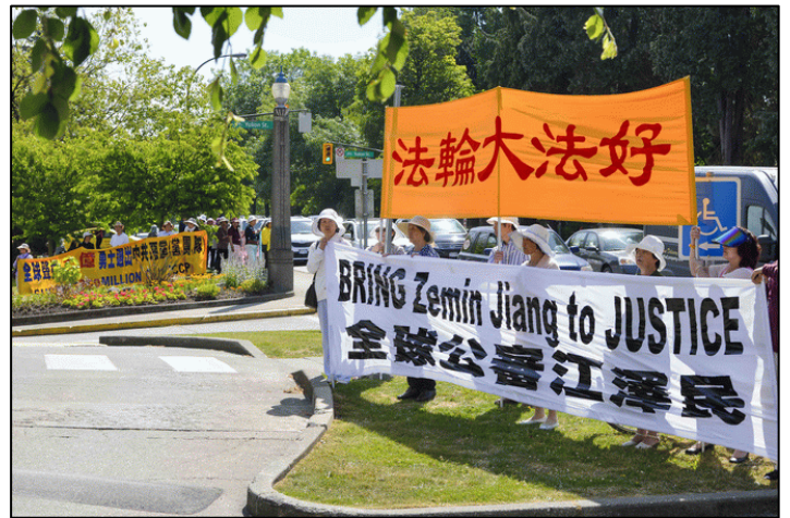
■ 温哥华法轮功学员在市政厅前沿街拉起横幅

个信息：迫害法轮功是反人类罪，将来是有报应的。追随江泽民迫害法轮功的大小官员，现在纷纷遭到被反腐败办等报应，全球正在掀