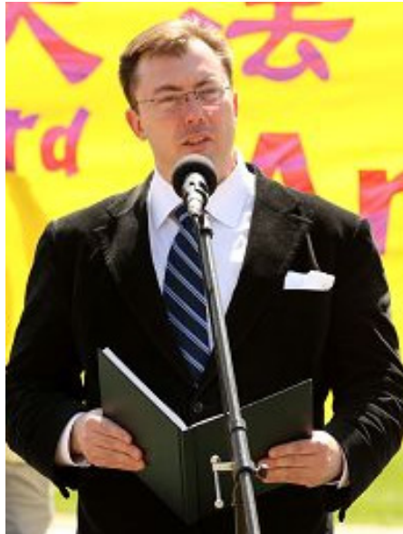
加拿大国会议员罗伯·安德斯