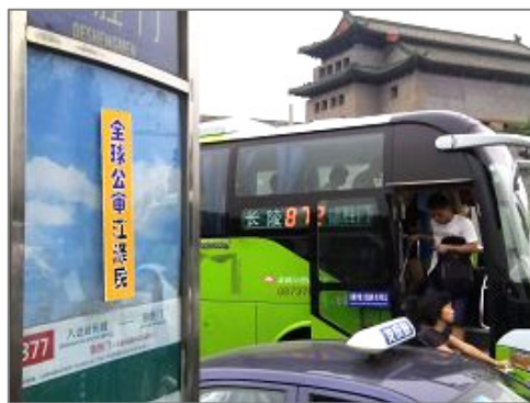
2015 年 6 月下旬，北京街头多处可见“全球公审江泽民”的标语。

某日，一位法轮功学员在街上碰到一位男士。此人高高的个子，夹着一个文件包，五十岁上下，看上去很