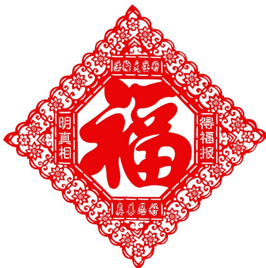
剪纸作品《法轮大法好》

虑我。我把窗户关上，烟就不会往屋里跑了。”听了这话，老俩口松了一口气，露出了笑容，并把我请进屋，又是沏茶又是拿水果。