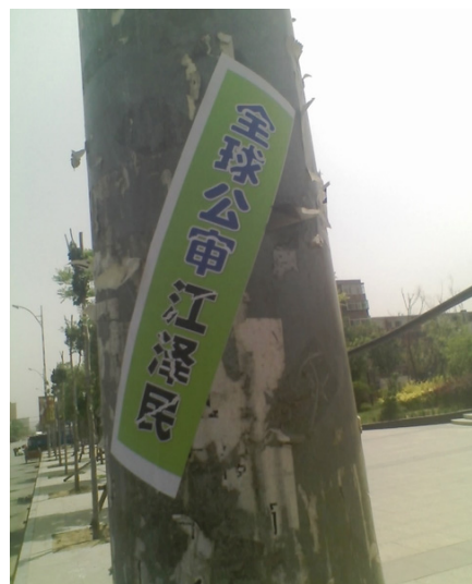
2015 年 5 月，云南昆明某公园内的“全球公审江泽民”标语（左图），辽宁一城市出现“全球公审江泽民”等标语（右图）。

造的滔天罪恶，是使江泽民之后的历届当政者都不敢向国际社会承认，不敢向全国百姓交代的罪大恶极之事。也是招致天灭中共的重要原因。