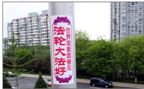
■ 2015 年 5 月，北京街道旁出现的“法轮大法好”标语。（明慧网）

第二天，J 所长领了一名警察到我家，看到两个孤零零的孩子连吃的也没有，他流泪了，用自己的