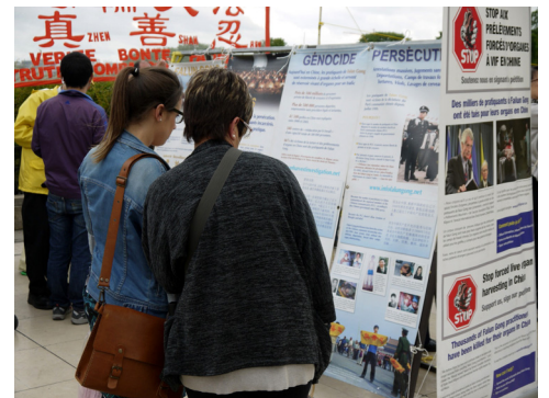
■ 游客观看真相展板