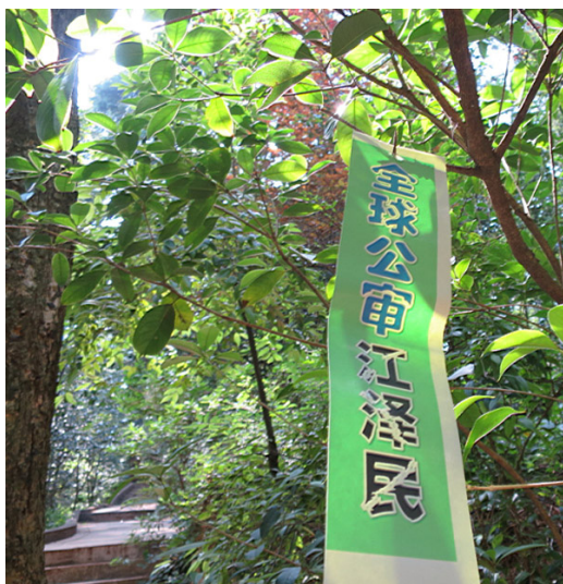
2015 年 5 月，云南昆明某公园内的“全球公审江泽民”标语（左图），辽宁一城市出现“全球公审江泽民”等标语（右图）。

和希特勒不同的是，江泽民更阴险狡诈。江泽民用谎言标榜自己，用造谣、污蔑、嫁祸等手段诽谤法轮功。希特勒一直认为自己民族的血统最优秀，而想方设法地谋杀犹太人。江泽民却针对本民族最具优秀品质的，按照真、善、忍的标准修炼自己的善良百姓进行酷刑屠杀。其惨烈程度是臭名昭著的纳粹集中营都无法相比的。尤其是活摘法轮功学员器官牟取暴利，以国家机关军队、武警、公检法司、卫生部为主导形成杀人产业制