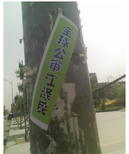
2015 年 5 月，云南昆明某公园内的“全球公审江泽民”标语（左图），辽宁一城市出现“全球公审江泽民”等标语（右图）。

造的滔天罪恶，是使江泽民之后的历届当政者都不敢向国际社会承认，不敢向全国百姓交代的罪大恶极之事。也是招致天灭中共的重要原因。