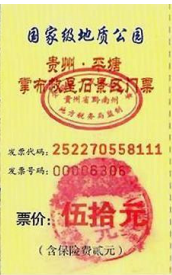
左二图：巴黎著名老店拉菲耶大商场内景；右图：贵州平塘县掌布乡桃坡村掌布谷国家地质风景公园门票

【明慧网】拉菲耶商场是巴黎百年老字号商场，每天都有大批的中国游客。近年来，法轮功学员也每天来到这里，在游客歇息之余，向他们讲真相、劝三退，让游客带回国的不仅仅是名表、香水和美酒，还有三退（退出中共党、团、队，简称三退）后的平安和美好的未来。