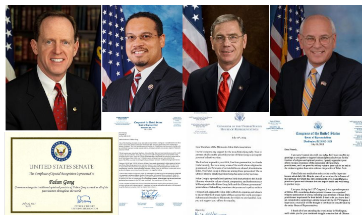
致信声援法轮功反迫害的部分美国国会议员及褒奖信

在 2015 年七·二零前夕，美国宾夕法尼亚州联邦参议员帕特里克·图米为法轮功颁发特别褒奖。