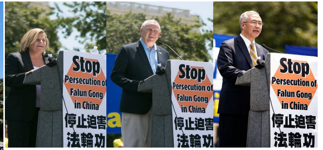
佛州国会众议员 加州国会众议员 追查国际代表 罗斯-莱赫蒂宁 罗拉巴克 汪志远 法轮功学员反迫害十六周年前夕, 法轮功学员及支持者在华盛顿国会山西草坪集会, 呼吁制止迫害