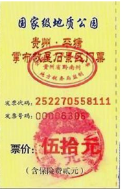
左二图：巴黎著名老店拉菲耶大商场内景；右图：贵州平塘县掌布乡桃坡村掌布谷国家地质风景公园门票

【明慧网】拉菲耶商场是巴黎百年老字号商场，每天都有大批的中国游客。近年来，法轮功学员也每天来到这里，在游客歇息之余，向他们讲真相、劝三退，让游客带回国的不仅仅是名表、香水和美酒，还有三退（退出中共党、团、队，简称三退）后的平安和美好的未来。