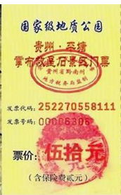
左二图：巴黎著名老店拉菲耶大商场内景；右图：贵州平塘县掌布乡桃坡村掌布谷国家地质风景公园门票

【明慧网】拉菲耶商场是巴黎百年老字号商场，每天都有大批的中国游客。近年来，法轮功学员也每天来到这里，在游客歇息之余，向他们讲真相、劝三退，让游客带回国的不仅仅是名表、香水和美酒，还有三退（退出中共党、团、队，简称三退）后的平安和美好的未来。