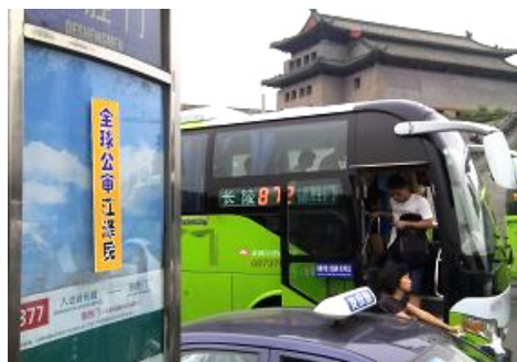
2015 年 6 月下旬，北京街头多处可见“全球公审江泽民”的标语。

退指退党、退团、退队）的事吗？给你个翻墙软件，你可以看到真实的中国和世界。”他说：“谢谢你，不麻烦你了。我会翻墙，我已经在网上退了。”接着又说：“我知道你们炼法轮功的都是好人。我在市公安局上班，是秘书。我没有直接参与迫害法轮功。等你们的李大师回国时，拜托一定替我说句好话，先谢谢你了！一定要帮我把话捎到啊！”◇