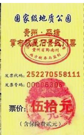
左二图：巴黎著名老店拉菲耶大商场内景；右图：贵州平塘县掌布乡桃坡村掌布谷国家地质风景公园门票

【明慧网】拉菲耶商场是巴黎百年老字号商场，每天都有大批的中国游客。近年来，法轮功学员也每天来到这里，在游客歇息之余，向他们讲真相、劝三退，让游客带回国的不仅仅是名表、香水和美酒，还有三退（退出中共党、团、队，简称三退）后的平安和美好的未来。