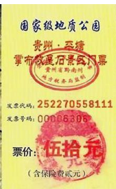
左二图：巴黎著名老店拉菲耶大商场内景；右图：贵州平塘县掌布乡桃坡村掌布谷国家地质风景公园门票

【明慧网】拉菲耶商场是巴黎百年老字号商场，每天都有大批的中国游客。近年来，法轮功学员也每天来到这里，在游客歇息之余，向他们讲真相、劝三退，让游客带回国的不仅仅是名表、香水和美酒，还有三退（退出中共党、团、队，简称三退）后的平安和美好的未来。