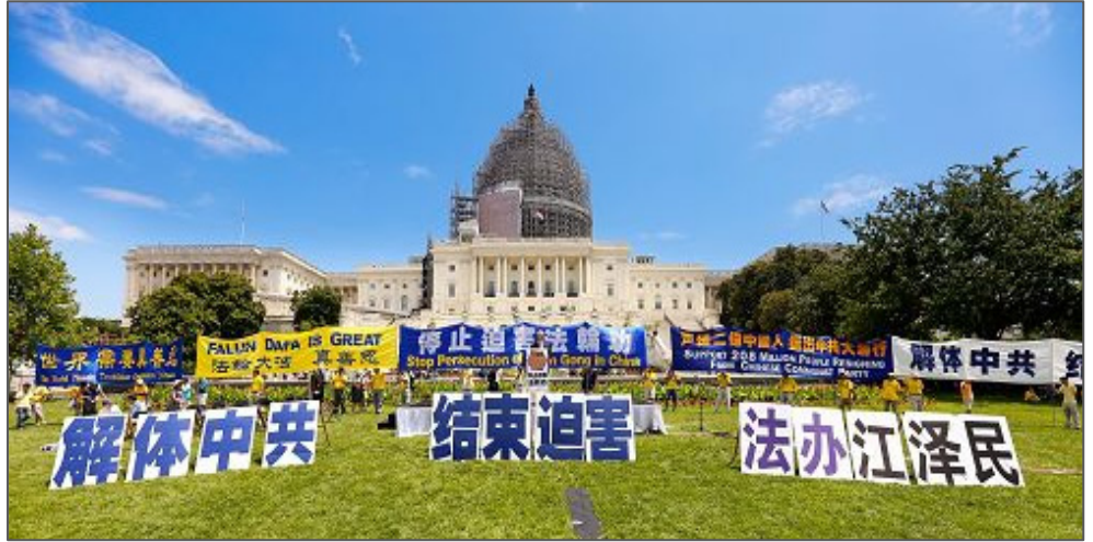
■ 法轮功学员反迫害十六周年前夕, 法轮功学员及支持者在华盛顿国会山西草坪集会, 呼吁制止迫害。

克说: “你们(法轮功学员)在扮演着非常重要的角色。不仅是为了你们的家人和朋友, 以及其他在中国受到迫害的人们, 同时你们在提醒我们的国家, 美国不只是一个人们从世界各地来这里赚钱的地方, 美国立国之本的价值在于作为自由和正义核心的那些道德问题。”