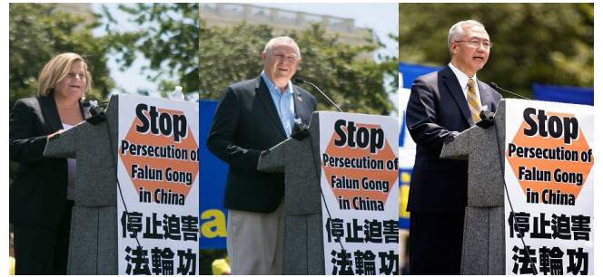
佛州国会众议员 加州国会众议员 追查国际代表 罗斯-莱赫蒂宁 罗拉巴克 汪志远

法轮功学员反迫害十六周年前夕，法轮功学员及支持者在华盛顿国会山西草坪集会，呼吁制止迫害