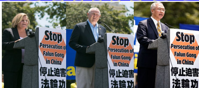
图:法轮功学员反迫害十六周年前夕,法轮功学员及支持者在华盛顿国会山西草坪集会,呼吁制止迫害