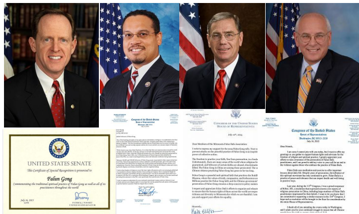
致信声援法轮功反迫害的部分美国国会议员及褒奖信

在2015年七·二零前夕，美国宾夕法尼亚州联邦参议员帕特里克·图米为法轮功颁发特别褒奖。