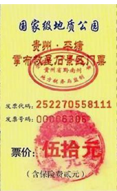
左二图：巴黎著名老店拉菲耶大商场内景；右图：贵州平塘县掌布乡桃坡村掌布谷国家地质风景公园门票

【明慧网】拉菲耶商场是巴黎百年老字号商场，每天都有大批的中国游客。近年来，法轮功学员也每天来到这里，在游客歇息之余，向他们讲真相、劝三退，让游客带回国的不仅仅是名表、香水和美酒，还有三退（退出中共党、团、队，简称三退）后的平安和美好的未来。