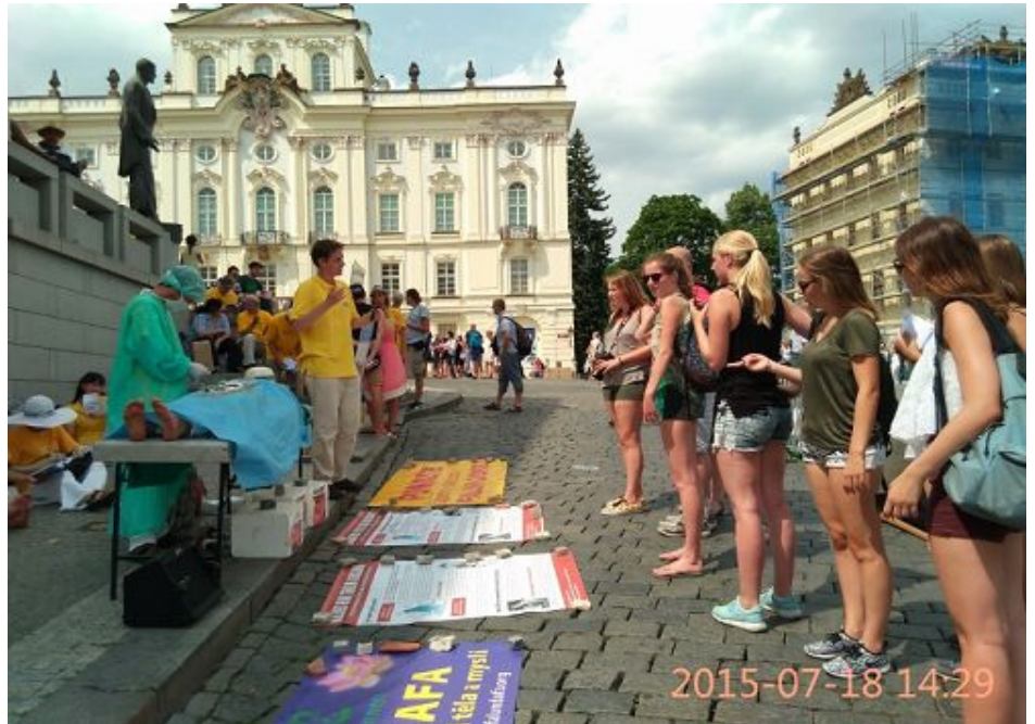
图:反迫害十六周年, 捷克法轮功在布拉格总统府门外广场传播真相, 揭露迫害, 并呼吁制止迫害。

在广场上有不少大陆民众前来观光, 其中有一家三口来捷克旅游, 学员跟他们讲真相劝“三退”时, 女主人说: “我们经常看你们网站, 了解很多情况。你们的真相资料我们都