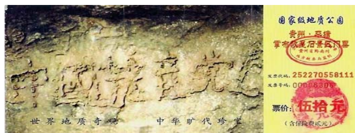
图：2002年6月在贵州发现的“藏字石”断面上显现“中國共產黨亡”六个大字，昭示着“天灭中共”的天意。

共用篡改历史、发动政治运动等手段打击正统信仰，进行了一次彻底的“反华运动”。它强制人们读马恩列斯毛的书，灌输“无神论”和暴力斗争哲学，用反天、反地、反人性的党文化，取代了中华正统文化。从1999年7月开始，其大法轮功“真善忍”信仰的迫害，更摧毁了中国社会的道德基础，使大陆人的生存环境全面恶化。中原大地上，清新的空气、干净的水源、安全的食物、人与人之间的和睦关系皆成奢求，整个社会陷入绝境。（另外，中共多次出卖中国领土，详见《九评共产党》。）