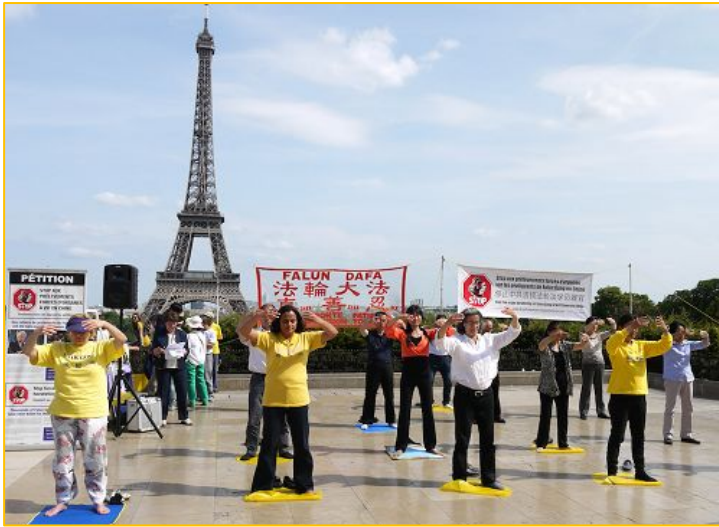
图：在著名的人权广场上，法轮功学员功法演示