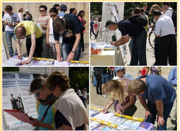
图：各国游人签字反迫害