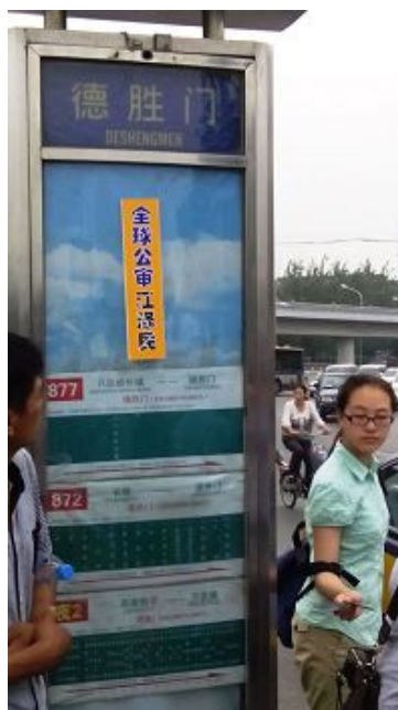
六月下旬，北京街头多处见到“全球公审江泽民”标语。