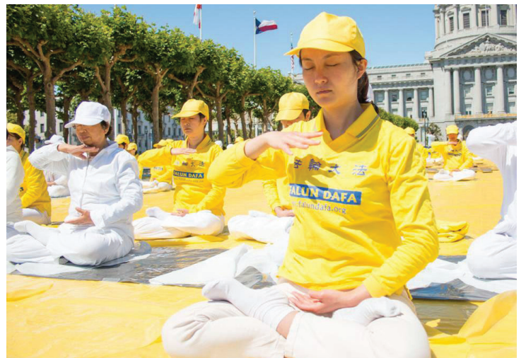
2015년 6월 6일, 400여 명의 파룬궁 수련생이 미국 샌프란시스코 시청 광장에서 인가와 연공을 하고 있다.

시간이 얼마나 흘렀을까, 눈을 돌려 시계를 보니 이미 새벽 3시 15분이었다. 나는 아랫배에서 뭔가가 나를 도와 수란관을 뚫어주는 느낌이 들었다. 그리고는 따뜻한 기운이 온몸에 퍼졌고 나는 두 발을 쭉 펼쳤다. 그러자 온몸에서 한 번도 없었던 편안함이 느껴졌고, 나는 벌떡 일어나 남편에게 먹을 것을 달라고 말했다.