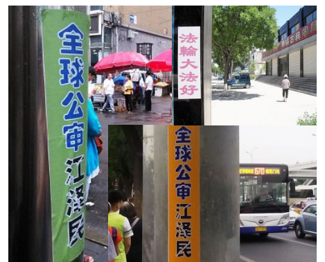
图：长春市、河北省、北京等地“审江、救人”的标语

有的地区政保科人员上门打听控告江泽民的事，问法轮功学员：“你告我了没？”当听说因为自己改变了、不再参与迫害法轮功的事了，法轮功学员并未控告他，政保科人员放心了，说：“那你告吧！”