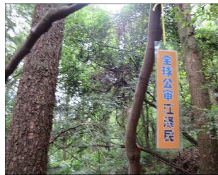
图：云南昆明风景区的真相标语

在云南昆明某风景区，多处可以看到：“法轮大法好”、“真善忍好”、“世界需要真善忍”、“全球起诉江泽民”、“全球公审江泽民”等真相条幅或挂图。