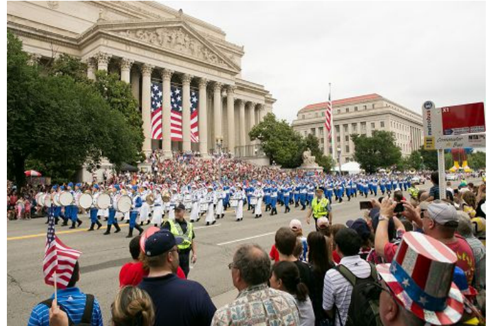
图:由法轮功学员组成的天国乐团连续第十年参加美国首都独立日游行

先生是第一次观看首都独立日游行,他表示很高兴看到游行队伍中不同族裔的方阵,这是美国精神的所在。同时,他表示在现代社会,信息传播速度很快,人们会很快了解中国对法轮功的迫害,可以做出努力去改变现状。◇