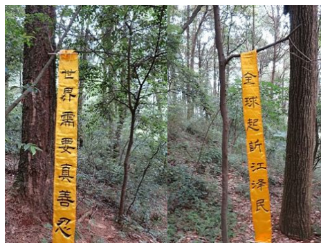
图：云南昆明风景区的真相标语

前，给最高检察院打电话（010-65209114）询问：“现在诉江的控告状你们收不收？”答：“收的，要寄就尽快寄过来。”