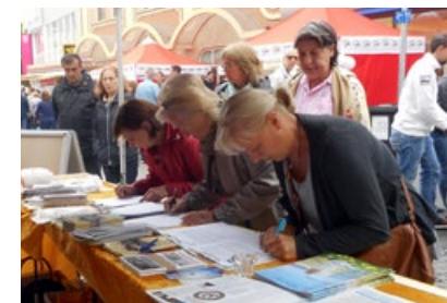
民众签名呼吁停止迫害法轮功

2015年6月21日，德国多特蒙德市慧德（Hoerde）地区举办第二届桥梁节，法轮功学员应邀在舞台上展示功法，许多德国民众了解了法轮功的美好和发生在中国的迫害，一些民众排队签名，呼吁制止中共活摘法轮功学员器官。两位市民对法轮功学员说：“我们来自波兰，共产党的坏我们早就知道。”“你们要一直做下去，不要停止。”◇