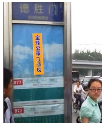
2015年6月下旬，北京街头多处可见审江标语。

6、江泽民滥用职权发动了长达16年的迫害法轮功运动，同时其出卖国土、结帮专权、贪腐淫乱，把中国社会推向丧失道德基准的境地。每个受害者（炎黄子孙、爱国人士、反贪腐的民众）都可以控告。◇