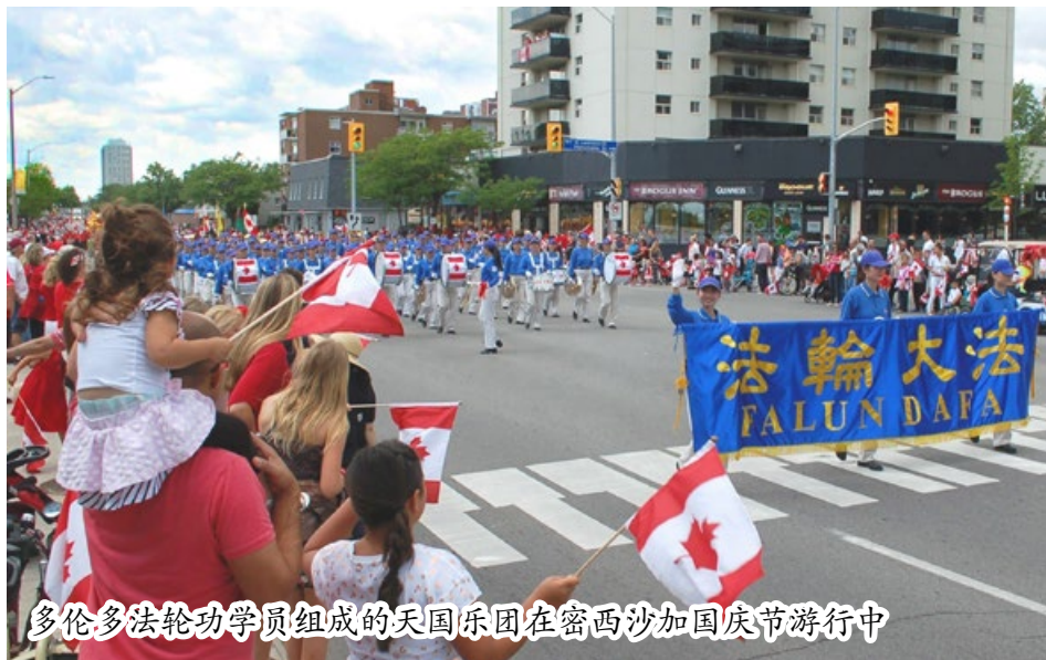
多伦多法轮功学员组成的天国乐团在密西沙加国庆节游行中