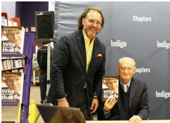
大卫·麦塔斯 (右) 在自传体新书《你为何那样做——人权倡导者的自传》发布会上与读者合影。

“（法轮功）受迫害者采取行动，这是积极的，但这只是一个开始，最终对方必须对申诉人予以回应。”