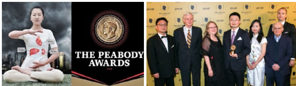
《活摘》荣获皮博迪奖纪录片大奖 《活摘》团队代表及嘉宾出席颁奖仪式