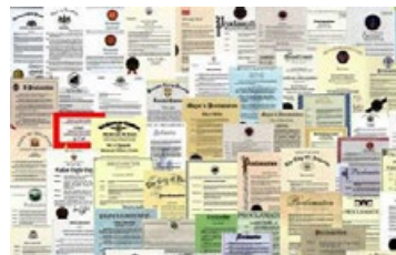
来自国际社会的褒奖（部分）

◎ 弘传世界 法轮大法已弘传到 100 多个国家和地区，受到世界人民的爱戴和尊敬。李洪志先生和法轮大法因对人类身心健康做出的杰出贡献，获各国政府褒奖、支持议案和信函 3000 多项。法轮功书籍被译成 40 种语言，在全球出版发行，并可在互联网上免费下载。◇