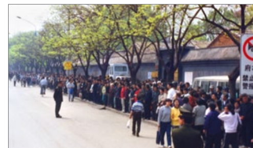
“4·25”上访现场秩序井然

2009 年 7 月 20 日，美中经济权威人士伊森·葛特曼在美国《国家评论》上发表长篇文章，讲述他对发生在中国的“4·25”真相的调查。1999 年 4 月 25 日，万名法轮功学员到北京府右街附近的国务院信访办和平上访，此事被中共江泽民集团渲染为“围攻中南海”。葛特曼的文章记述了对当事警察和法轮功学员的访谈，再现了“4·25”上访前发生的一系列引发此次上访的导火索。文章最后说：“法轮功没有挑起这场战争。是中共挑起的。”“我们应该更好地了解法轮功的真实历史。”◇