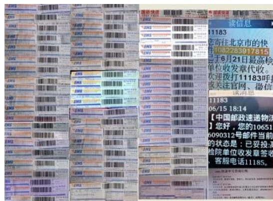
递交最高检、最高法的控告书快递回执

在控告请求中,吴宝库强烈要求最高人民检察院依法立案,侦查被告人江泽民犯罪集团涉嫌群体灭绝罪、危害人类罪、酷刑罪、非法剥夺公民宗教信仰自由罪、非法剥夺公民人身自由罪、破坏法律实施罪等数罪刑事案件,追究其刑事责任,等等。顺天意,得民心,让被江氏集团谎言欺骗的世人早日明真相得救。