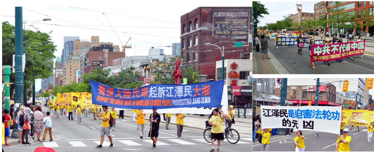
八月八日，加拿大多伦多法轮功学员在市中心举行声援全球诉江游行