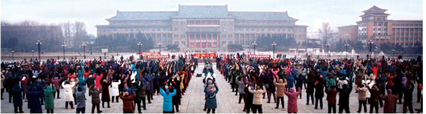
历史图片：1999 年迫害前，长春一法轮功炼功点集体晨炼场景

我原是军队的一名中级领导干部，因为坚持修炼法轮大法被免职，提前退休。在常人（普通人）看来我失去很多。我的一位领导就劝我：好汉不吃眼前亏，法轮大法也不缺你一个，何必呢！还有一位领导说：不抽烟，不喝酒，不进舞厅，不收红包，你活着为了啥？常人真的不理解修炼人。