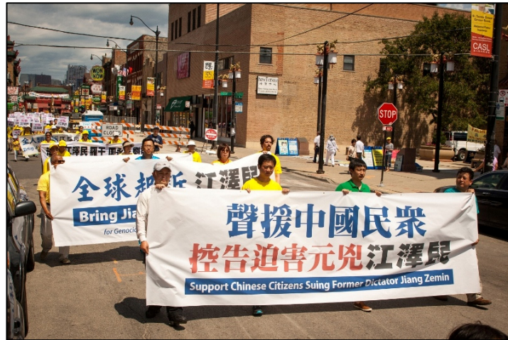
八月一日法轮功学员在芝加哥中国城游行,声援诉江潮

予热情协助。他们表示,希望把江泽民送上法庭。有的说:江泽民太坏了,恶事干尽,把中国人的传统文化和思想糟蹋了,又极端腐败。