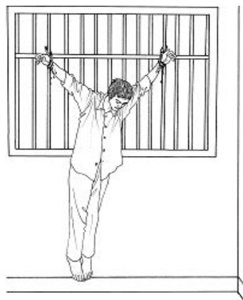
酷刑演示：吊铐又称上大挂

一次次迫害使我的妻子无力再承受这种精神上的折磨，她被迫与我提出离婚，我好端端的一个家庭就这样被拆散了。◇