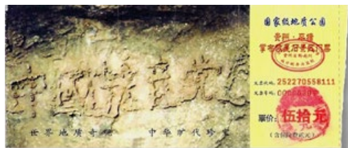
贵州省平塘县掌布乡发现了距今27亿年的藏字石，巨石断面上露出天然形成的6个大字“中國共產党亡”。图为藏字石风景区门票。

中国人加入中共的组织时，要发誓把自己的一生献给“党”，为其奋斗终生。这样的誓言，意味着人的生命永远属于其党。在全世界，只有共产党才让人发这样的毒誓。誓言要兑现，人忘天不忘。中共组织是由党员、团员、少先队员组成的，天灭中共时，这些人就会跟着遭殃。声明“三退”是废除毒誓，远离这个邪恶组织，获得天佑平安。◇