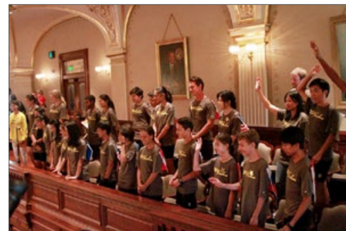
2015年7月1日，伊利诺伊州议院邀请骑手们进入议员开会的大厅旁听议程，并正式介绍了“骑向自由”。