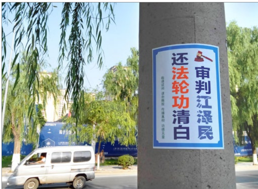
2015 年 7 月，中国大陆多地出现“诉江”真相标语。图片摄于长春市。