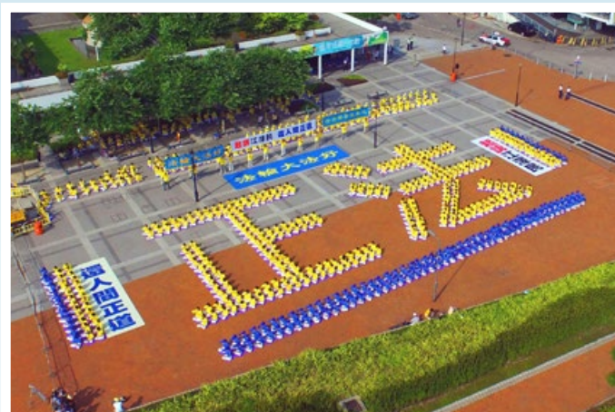
摄影：“正法”的光芒照耀香港中环爱丁堡广场 (2015 年 7 月 19 日)