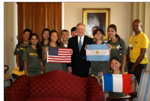
2015年7月16日下午，联邦参议员理查德·德宾在国会大厦办公室中接待了部分青少年骑手。