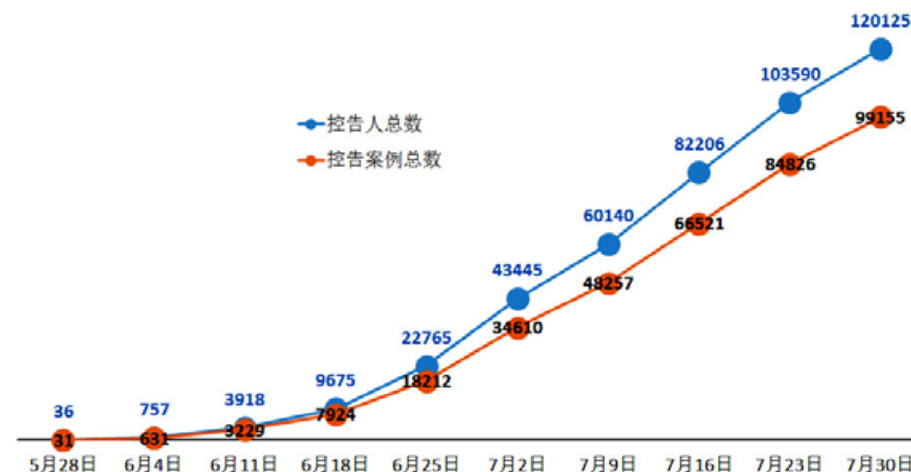
控告江泽民案例总数和控告人总数随时间增长图