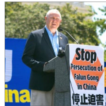
加州国会众议员达纳·罗拉巴克

加州国会众议员达纳·罗拉巴克感谢法轮功学员。他说：“你们不仅是为了家人、朋友及其他在中国受迫害的人，同时你们在提醒我们的国家，作为一个美国人，我们代表什么；你们在提醒我们的国家，美国不只是一个人们从世界各地来赚钱的地方。我不反对赚钱，我要说的是，美国立国之本的价值超出了自由贸易，其价值在于作为自由和正义核心的那些道德问题。”罗拉巴克说：“美国必须和你们站在一起，否则全世界任何地方的受害者都会没有了机会、失去了希望。这是美国国会上空飘扬的国旗所代表的意义。”