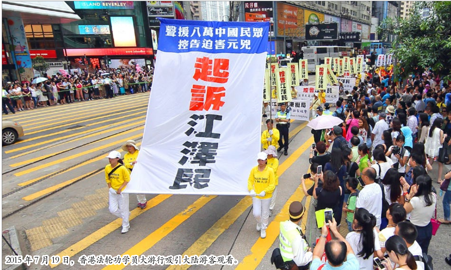
2015年7月19日，香港法轮功学员大游行吸引大陆游客观看。