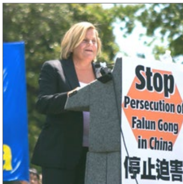
佛州国会众议员罗斯-雷婷恩

佛罗里达州国会众议员伊丽安娜·罗斯-雷婷恩说：“法轮功修炼者们，你们平和、善良和坚忍。你们应因你们的信仰而受到尊重。”“中共通过其官方媒体不断诽谤法轮功。我们知道，法轮功学员遭受酷刑折磨，我们也知道中共近年来强摘法轮功学员器官的非法行径。”“我在众议院发起了343号决议案，以表达我们严重关注在中国的、系统性的、政权认可的、从非自愿的良心犯身上强摘器官的行为。我为自己能发起这项决议案感到自豪。我们总有一天会在这里再次相聚，为中国的法轮功学员获得自由而庆祝。”