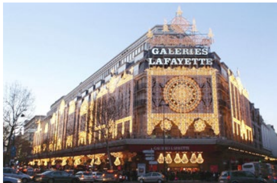
巴黎百年老字号拉菲耶商场

拉菲耶商场是巴黎百年老字号，每天都有大批的中国游客光顾。在此处讲真相的法輪功学员会在游客歇息之余告诉他们真相福音，让游客带回国的不仅是名表、香水和美酒，还有“三退”（退党、退团、退队）后的平安和美好的未来。