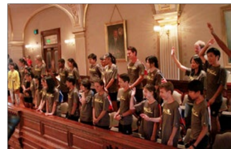
2015年7月1日，伊利诺伊州议院邀请骑手们进入议员开会的大厅旁听议程，并正式介绍了“骑向自由”。