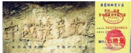
贵州省平塘县掌布乡发现了距今2.7亿年的藏字石，巨石断面上露出天然形成的6个大字“中國共產党亡”。图为藏字石风景区门票。

中国人加入中共的组织时，要发誓把自己的一生献给“党”，为其奋斗终生。这样的誓言，意味着人的生命永远属于其党。在全世界，只有共产党才让人发这样的毒誓。誓言要兑现，人忘天不忘。中共组织是由党员、团员、少先队员组成的，天灭中共时，这些人就会跟着遭殃。声明“三退”是废除毒誓，远离这个邪恶组织，获得天佑平安。◇