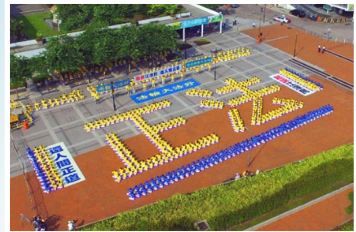
摄影：“正法”的光芒照耀香港中环爱丁堡广场 (2015 年 7 月 19 日)