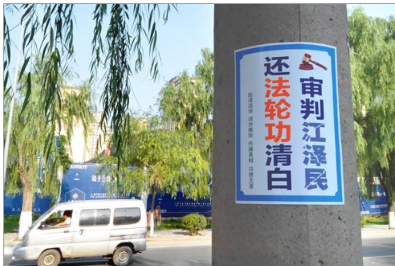
2015年7月，中国大陆多地出现“诉江”真相标语。图片摄于长春市。