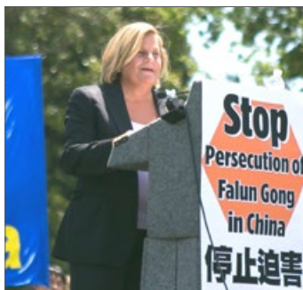
佛州国会众议员罗斯-雷婷恩

佛罗里达州国会众议员伊丽安娜·罗斯-雷婷恩说：“法轮功修炼者们，你们平和、善良和坚忍。你们应因你们的信仰而受到尊重。”“中共通过其官方媒体不断诽谤法轮功。我们知道，法轮功学员遭受酷刑折磨，我们也知道中共近年来强摘法轮功学员器官的非法行径。”“我在众议院发起了343号决议案，以表达我们严重关注在中国的、系统性的、政权认可的、从非自愿的良心犯身上强摘器官的行为。我为自己能发起这项决议案感到自豪。我们总有一天会在这里再次相聚，为中国的法轮功学员获得自由而庆祝。”