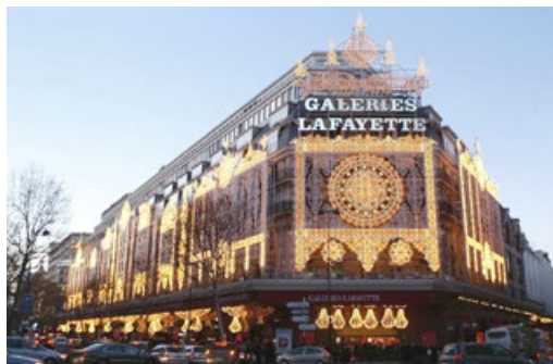
巴黎百年老字号拉菲耶商场

拉菲耶商场是巴黎百年老字号，每天都有大批的中国游客光顾。在此处讲真相的法輪功学员会在游客歇息之余告诉他们真相福音，让游客带回国的不仅是名表、香水和美酒，还有“三退”（退党、退团、退队）后的平安和美好的未来。