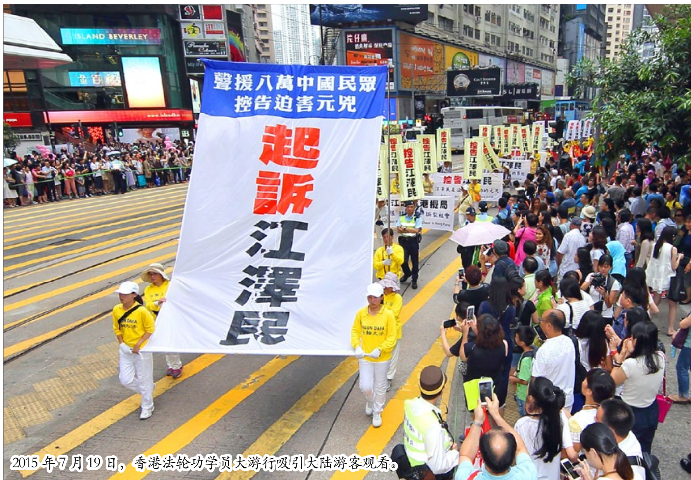
2015年7月19日，香港法轮功学员大游行吸引大陆游客观看。