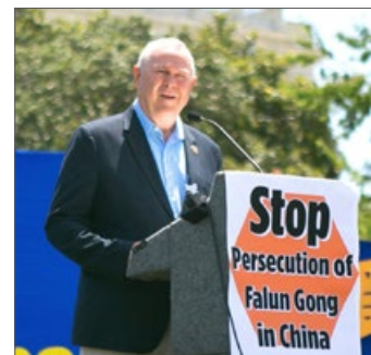
加州国会众议员罗巴克

加州国会众议员达纳·罗巴克感谢法轮功学员。他说：“你们不仅是为了家人、朋友及其他在中国受迫害的人，同时你们在提醒我们的国家，作为一个美国人，我们代表什么；你们在提醒我们的国家，美国不只是一个人们从世界各地来赚钱的地方。我不反对赚钱，我要说的是，美国立国之本的价值超出了自由贸易，其价值在于作为自由和正义核心的那些道德问题。”罗巴克说：“美国必须和你们站在一起，否则全世界任何地方的受害者都会没有了机会、失去了希望。这是美国国会上空飘扬的国旗所代表的意义。”