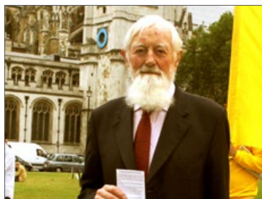
英国上议院议员希尔顿勋爵

◎英国 法轮功学员于2015年7月15日和18日分别在英国国会大厦、英首相府外举办讲真相、反迫害活动，多位国会议员走出国会大厦前来表示支持，另有多位欧洲议员和英国国会议员发来信函支持法轮功。英国上议院议员希尔顿勋爵首先来到活动现场对法轮功学员说：“长时间以来，我非常关注中国的恶劣人权（纪录），你们做得对，要求对那些施行人权迫害的凶手进行起诉，并让他们受到法律的审判。我祝你们好运！”