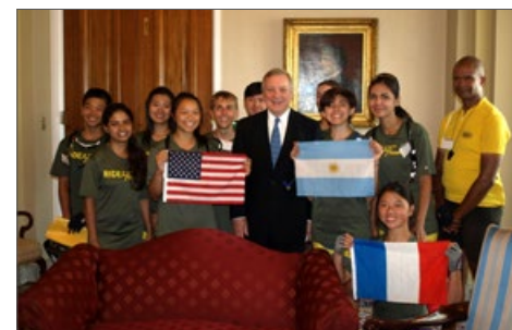
2015年7月16日下午，联邦参议员理查德·德宾在国会大厦办公室中接待了部分青少年骑手。