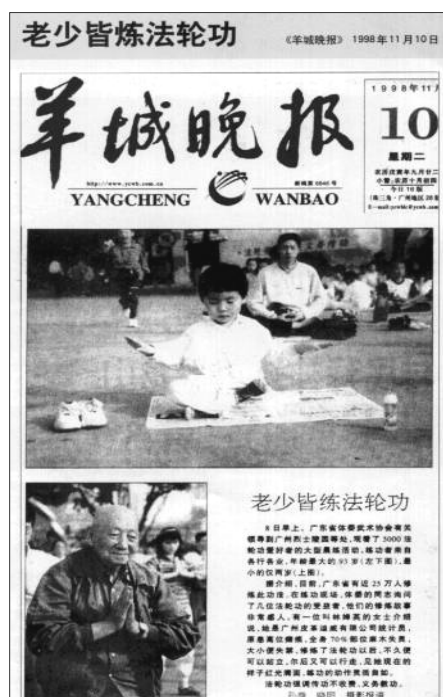
《羊城晚报》：老少皆炼法轮功（1998 年 11 月 10 日）