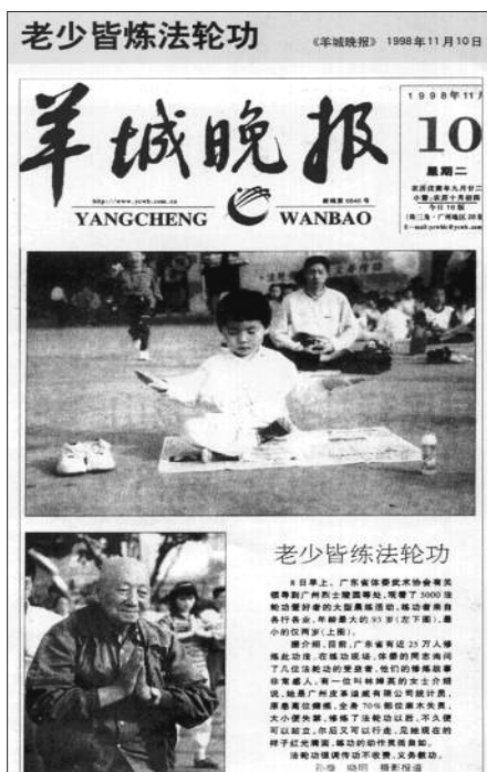
《羊城晚报》：老少皆炼法轮功（1998 年 11 月 10 日）