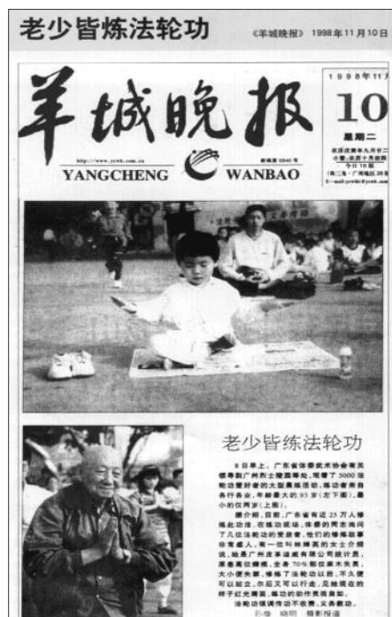
《羊城晚报》：老少皆炼法轮功（1998 年 11 月 10 日）