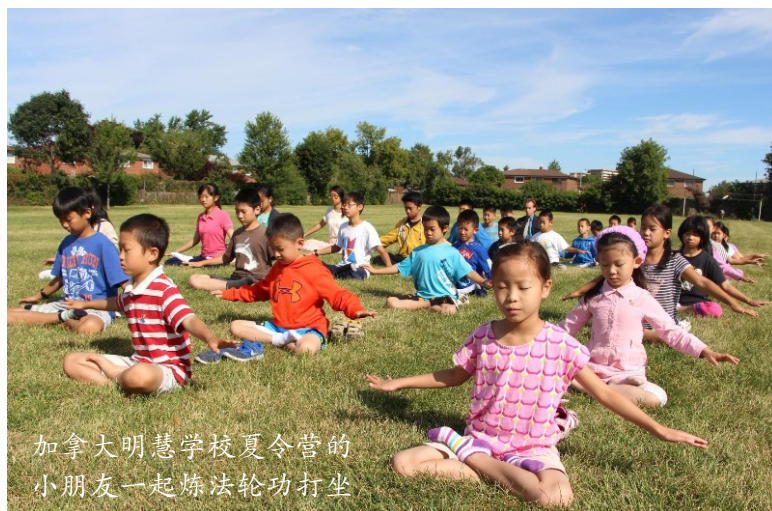
加拿大明慧学校夏令营的小朋友一起炼法轮功打坐

辽宁抚顺市新宾县一派派出所警察，给法轮功学员打电话查询是否写过诉江状，学员给了他肯定的答复。警察最后说：“其实我挺佩服你们的，我打了这么多电话，没有一个不承认的！”◇