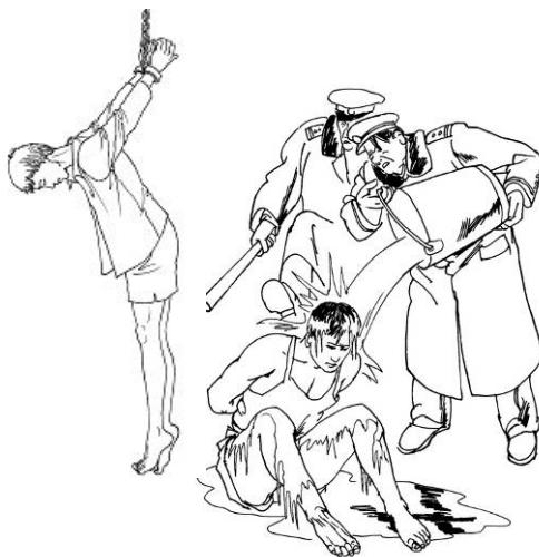
中共酷刑示意图：上绳吊铐；浇冰水

我曾患有心脏、肾炎、肾结石、胆囊炎、严重神经衰弱、胃病、长期失眠等综合疾病，每年报销医疗费 3