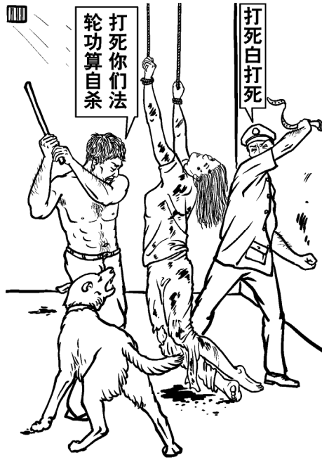
■ 中共酷刑示意图：毒打

南山集团有一种酷刑，叫“烤全羊”，受刑者被戴上手铐吊在空中，象烤羊似的，从脚底将绳子掏出，吊在一个木柱子上，游荡起来，这种刑罚恶警自说一般人都受不了。还有一种酷刑是“打秋千”，两腿绑在一块，两手脖后绑着，弄铁棒从前大腿抬起吊着，头朝下，前后推动着，再用电棒电击。龙口